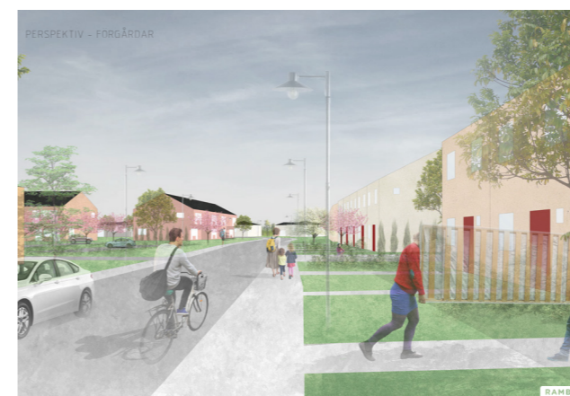
Exempel visar förslag på hur det nya bostadsområdet vid Runnabäcken 2 kan komma att se ut.