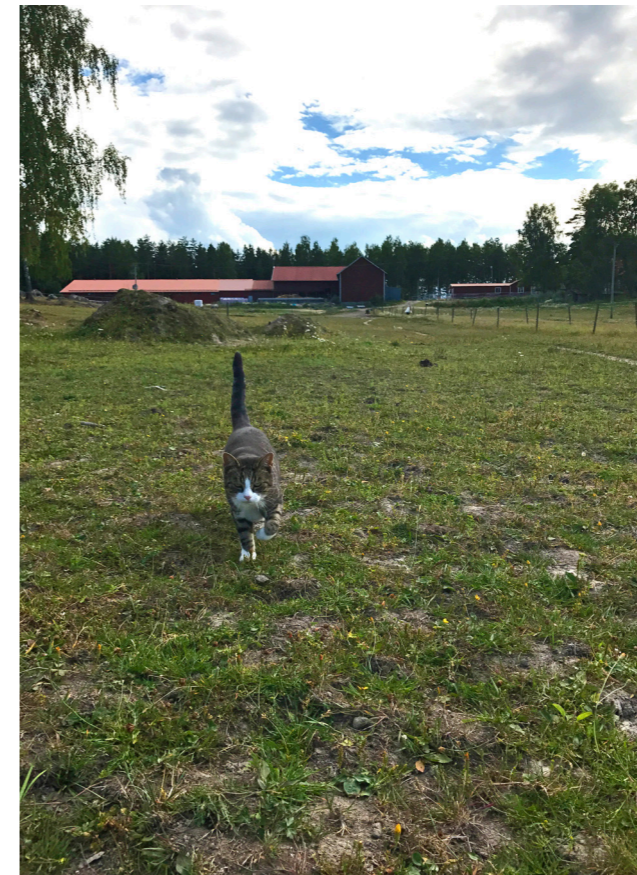
I Klämsbo finns Kungsörs Ridklubb med både ridhus, ridbanor med fibersand och vacker ridterräng.