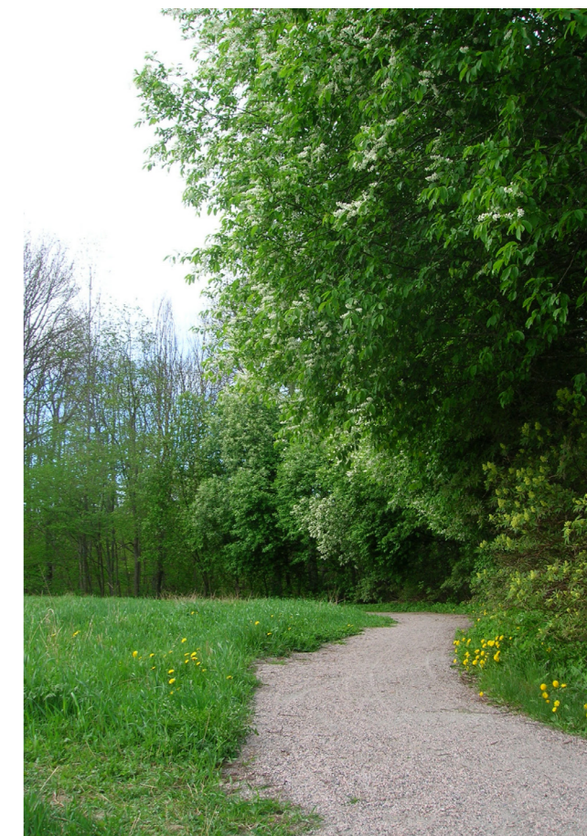
Längs Runnabäcken finns populära promenadstråk med rik växtlighet och fågelsång.